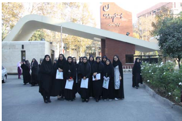
حضور اعضای دانشگاه الزهراء (س) در مجامع بیرونی مجامع خارجی

تاریخ ۹۶/۸/۲۳ از مکانهای مختلف دانشگاه بازدید نموده و در رویداد استارت آپ دانش آموزی در مرکز نوآوری و کارآفرینی شرکت کردند.